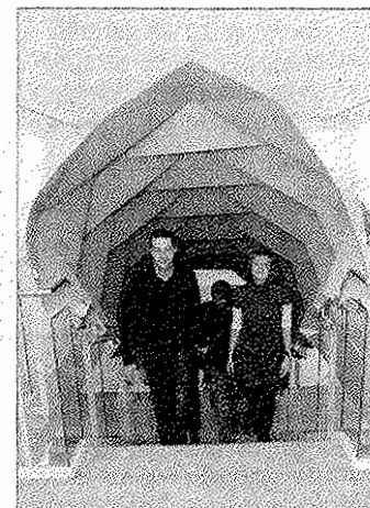
Transformers heißt dieser flexible Baldachin.

Zu sehen bleibt die Ausstellung im 2. Obergeschoss der Villa bis zum 1. März.