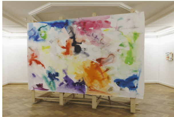
Blick in die Ausstellung: Klaus Schmitt, o.T., 2011

Wasser | Farbe Colour | Water 05.11.2011 - 11.03.2012