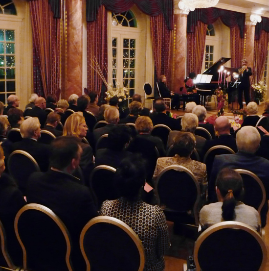
Konzert im Ballsaal des Grandhotel Schloss Bensberg