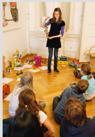
Museumspädagogisches Begleitprogramm: Schüler-Atelier

dem Verein Freunde der Städtischen Galerie Villa Zanders. Mit unseren ausgewogen konzipierten Veranstaltungen zu Kunst, Literatur, Musik, Philosophie und Politik beleben wir das kulturelle Potential der Stadt. Das museumspädagogische Begleitprogramm zu den Ausstellungen mit historischer und zeitgenössischer Kunst umfasst spannende Bildungs- und Kreativangebote für Jung und Alt. Aus unserer umfangreichen Artothek können Sie jederzeit hochkarätige Werke für Ihre Privaträume ausleihen. Unsere sorgfältig vorbereiteten Kulturreisen bieten Gelegenheit zur geselligen Erkundung kunsthistorischer Sehenswürdigkeiten.