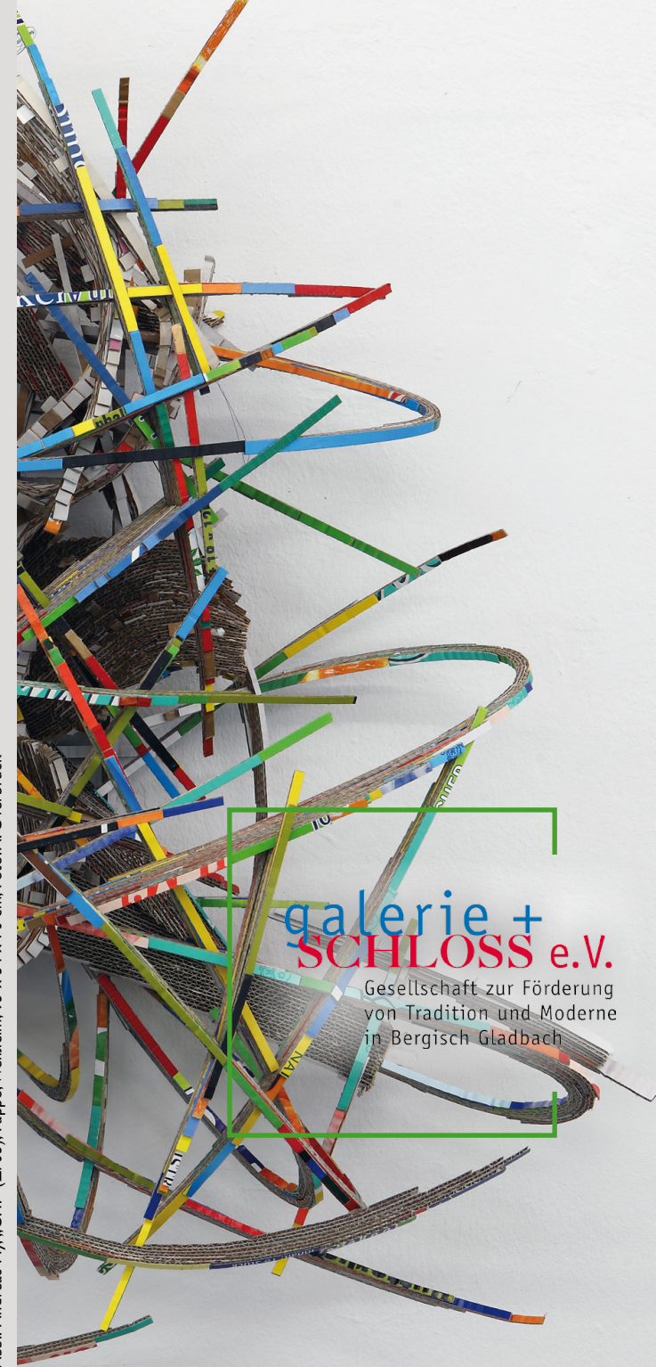
Abb.: Andreas My, „O.T.“ (ZF03); Pappe, Weißbleim; 93 x 34 x 70 cm

Kreissparkasse Köln BLZ 370 502 99 Konto 311 022 227